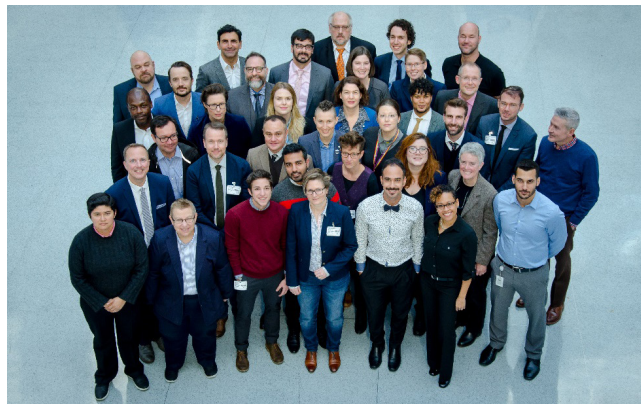
Imagen 2. Consultas en persona acerca de los indicadores del Índice de Inclusión LGBTI

Estas finalidades, que otorgan prioridad a las comparaciones entre países y a lo largo del tiempo, son los objetivos principales utilizados para justificar los indicadores preliminares que se presentan más abajo.